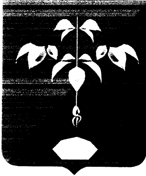
«Рисунок герба Партизанского городского округа»